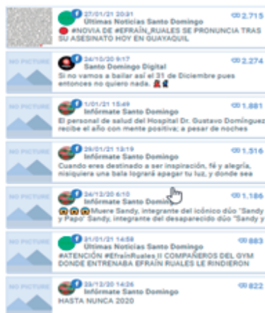
Figura 3. Publicaciones más exitosas de texto

Nota: La figura demuestra el nivel de respuesta de la comunidad a las publicaciones realizadas por los medios digitales estudiados. Resalta en color marrón, las publicaciones del medio Infórmate Santo Domingo que están siempre sobre el promedio.