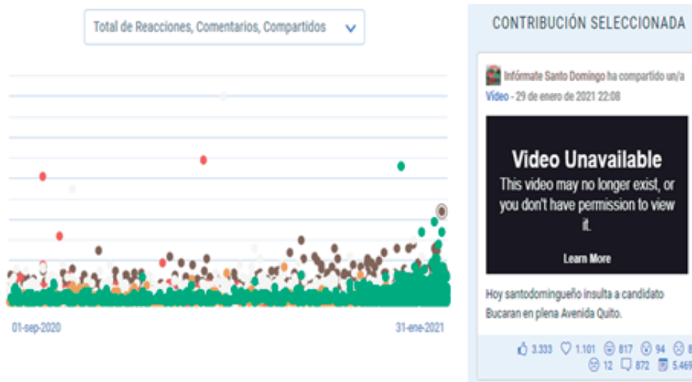
Figura 2. Publicaciones más exitosas en el período de estudio

Este análisis preliminar de indicadores clave de rendimiento, permite identificar al medio Infórmate Santo Domingo como uno de los de mejor desempeño durante del período de estudio. Gracias al servicio de análisis contratado para la presente investigación, se pueden obtener datos comparados, útiles para resaltar la presencia y el desempeño de este medio digital: