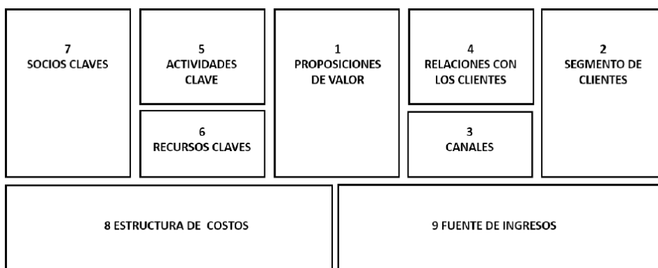
Figura 1. Lienzo CANVAS