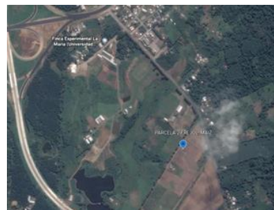
Figura 1. Ubicación geográfica del lote

El presente ensayo se está realizando en La Finca Experimental La María, perteneciente a la Universidad Técnica Estatal De Quevedo (UTEQ), en la provincia de los ríos cantón Mocache en las coordenadas Latitud - 1,0856007 y longitud - 79,4974162 a 64.7 msnm, Utilizando las semillas de frejol Tumbe (Vigna unguiculadal (L). Walp), frejol Cargabello, Maíz Somma, maíz canguil.