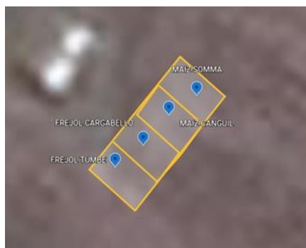
Figura 3. Asignación del cultivo

Para el cultivo de frejol se asignaron las parcelas 1 y parcela 2, sembrando en la parcela N°1 el frejol tumbe (Vigna unguiculada (L) la cual se le llamara L1, y en la parcela N°2 se sembró el frejol cargabello se le llamara L2, para la parcela N°3 el maíz Canguil llamada L3 y para la parcela N°4 se sembró la semilla de maíz Somma se asignará el nombre L4.