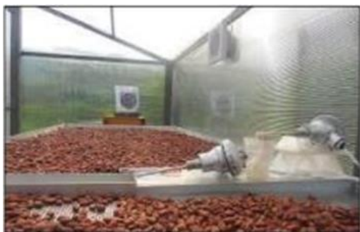
Figura 2. Secado artificial del cacao.