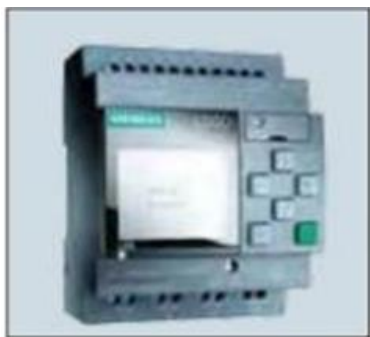
Figura 4. Modelo de LOGO 8.2

En la figura 13 se muestra un módulo lógico LOGO Siemens 8.2 de 110-220 V AC, el cual brinda una capacidad de comunicación ampliada gracias a su puerto de comunicación Ethernet integrado, el cual permite comunicarse hasta con 8 dispositivos Ethernet adicionales (Ej: ¡módulos lógicos LOGO!, Simatic S7-1200, paneles Simatic HMI, etc.) (Siemens, 2017).