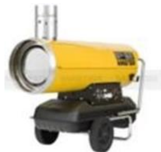
Figura 6. Generador de aire caliente

Empleado principalmente para el calentamiento de recintos como almacenes, talleres de construcción e invernaderos ver modelo en la figura 14, el cual posee una potencia de salida de 28.400 Kcal/h.