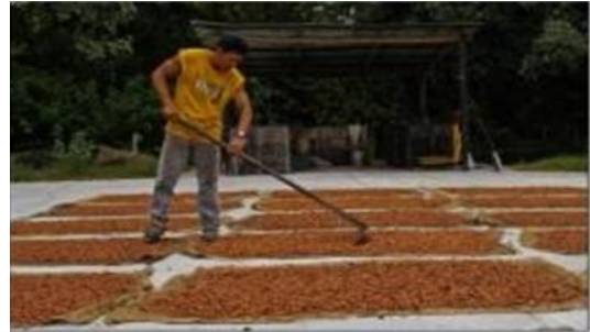
Figura 1. Secado natural del cacao.

Este secado es el habitual y consiste en exponer los granos al sol o al ambiente para que se sequen. En la figura 1 se observa este método, puede ser eficaz y de alta calidad si el sol es adecuado. Seguramente si esto ocurre y el manejo se hace bien, el cacao alcanza alta calidad, pero si esto no ocurre como en zonas de transición entre sierra y la costa o en la amazonia ecuatoriana, entonces el cacao se enmohece (INIAP, 2012).